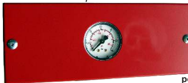
BIP01 avec manomètre pour coffret Ouv./Ferm.